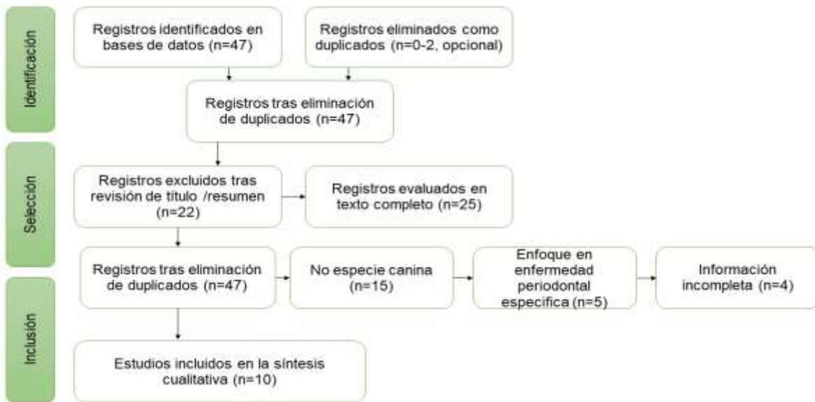
Diagrama de flujo prisma del proceso de selección de estudios

Nota: elaboración propia a partir de la revisión sistemática